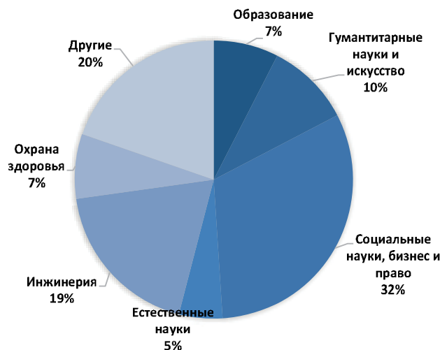
Рис.1. Ценностная приоритетность образовательных сфер среди студентов Украины. Составлено авторами по материалам [4].

Важность трансформации управления образовательным процессом в Украине обусловлено тем, что, несмотря на высокие количественные показатели уровня финансирования, Украина отстает от развитых стран по его качеству и вкладом в научно-технический прогресс. Согласно рейтингу глобальной конкурентоспособности ВЭФ 2016/17 гг. Украина заняла высокое 33-е общее место по высшему образованию и обучению среди 138 стран, в котором учитывается ряд характеристик, и самой высокой из них стало количество лиц, получающих высшее образование, заняв 11-ю позицию [12]. Однако по показателям его качества, взаимосвязи между образовательными учреждениями и бизнесом, внедрения инновационных технологий в производство, достижений академических, в частности гуманитарных наук, Украина находится не на таких высоких позициях. Причиной этому может выступать структура специальностей, по которым обучаются студенты, и из которой формируются данные показатели. В Украине наблюдается следующая тенденция популярности и ценности образовательных программ. Самыми востребованными для абитуриентов являются право, экономика и предпринимательство, менеджмент и администрирование (рис.1). Несмотря на большое разнообразие специальностей инженерии самыми многочисленными являются сфера информатики и вычислительной техники, машиностроения и материалообработки, другие специальности инженерии пользуются меньшим спросом. Так же гуманитарные науки остаются привлекательными для многих студентов.