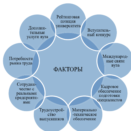
Рис. 3. Совокупность факторов, влияющая на ценообразование образовательных услуг. Составлено авторами.

Таким образом, высшее образование рассматривается как основной двигатель экономического развития, и оплата образовательных услуг является своеобразной окупаемой инвестицией, несмотря на восходящую динамику цен, обусловленную действием комплекса факторов рыночного и нерыночного характера. Величина стоимости образовательной услуги значительной мерой измеряется ее полезностью, потребительской стоимостью и проявляется как необходимое благо для личности и общества в целом.