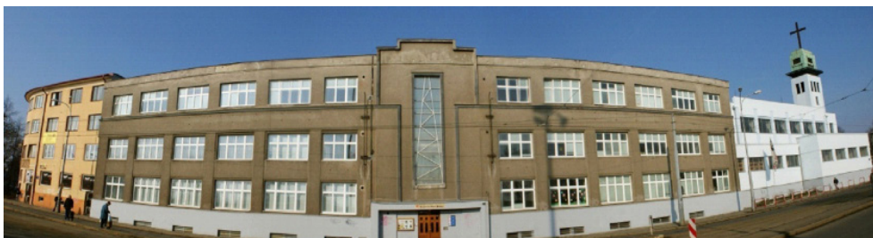
Rys 2. Widok budynku instytutu salezjańskiego (salezjańskiego centrum), kościoła (po prawej) i budynków klasztornych w Ostrawie (po lewej)

Fig 2. Salesian institute building view (Salesian center), the church (right) and buildings of the monastery (left) in Ostrava.