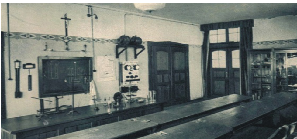
Rys 4. Dawna sala do nauki fizyki w klasztorze Urszulanek w Lubomierzu

znaczeniu kulturowym, z którymi lokalna ludność chętnie się identyfikuje. Otwarcie obiektów klasztornych dla świeckich użytkowników nierozdzielnie wiąże się z ich społecznym oddziaływaniem. To pole bardzo szerokie i niewątpliwie trudne do precyzyjnego zdefiniowania. Już sama obecność zakonników i obiektów przez nich budowanych w średniowiecznych miastach, oddziaływała na społeczeństwo i wymuszała konkretne zachowania społeczne. Konsekwencją tego było wprowadzenie i ukształtowanie lokalnej estetyki społecznej. Niewątpliwie, dominujące nad zabudową świecką założenia klasztorne były urzeczywistnieniem odwiecznego dążenia do trwałości i piękna w architekturze. Dla lokalnej ludności stanowiły niedościgniony wzór, zarówno w zakresie innowacyjnych rozwiązań konstrukcyjnych, ale także w zakresie formy, detalu czy zdobnictwa. Klasztory i obiekty sakralne były także miejscami, w których ludność obcowała z dziełami sztuki malarskiej czy rzeźbiarskiej, wykonanymi nierzadko przez znakomych artystów 19 sprowadzanych przez zakonników. 20