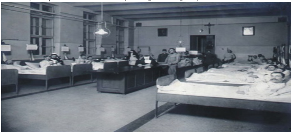
Rys 5. Męska sala chorych w czasie I Wojny Światowej.