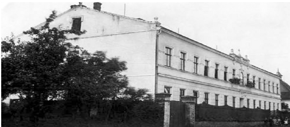
Rys 1. Frontowa, piętnastoosiowa fasada klasztoru Dominikanek w Klimovicach, fotografia z 1926 roku; centralnie widoczna nisza zamiast okna

Analizując architekturę klasztorów pamiętać należy o tym, że różnorodność misji duchowej zakonów odzwierciedla się w różnorodności form ich siedzib. Na analizowanym obszarze występują tylko zgromadzenia wspólnotowe, stąd pokrewieństwo dyspozycji przestrzennej ich siedzib jest oczywiste i czytelne. Wraz z upływem czasu, a więc zmieniającymi się wymogami i możliwościami, każdy ustalony typ zabudowań klasztornych ulega jednak pewnym modyfikacjom. Należy także mieć na uwadze fakt, że wspólnotowy charakter mają także kongregacje, które w przeciwieństwie do zakonów nie wykształciły skryzalizowanych typów zabudowań. Kształt wznoszonych przez nie zabudowań wynika bowiem raczej ze względów utylitarnych, niż narzuconej im odgórnie formy 4 . Ponadto pamiętać należy o tym, że obszar Śląska Cieszyńskiego i Księstwa Opawskiego rozwijał się dynamicznie, a wielokulturowe, tolerancyjne społeczeństwo akceptowało i nadal akceptuje różnorodność zabudowy, kładąc przede wszystkim nacisk na jej użyteczność.