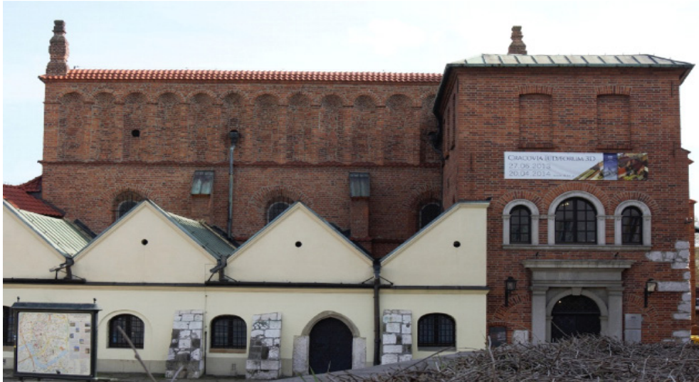
Fot. 2. Synagoga Stara w krakowskim Kazimierzu. Photo 2. Old Synagogue in Cracoviensis Kazimierz.

Ta sama zasada obowiązywała w odniesieniu do architektury świeckiej, co nie oznacza jednak, że wszystkie elementy cechujące architekturę chrześcijańską zostały powielone w obiektach zamieszkałych przez Żydów. Jedną z różnic jest np. wynikający ze wspomnianego zakazu bałwochwalstwa brak rzeźb. Równie istotną różnicą jest stosowanie typowo judaistycznego (niewystępującego w architekturze chrześcijańskiej) detalu architektonicznego, zamieszczanego w zróżnicowanym kontekście przestrzennym, a mianowicie przedstawień menor 7 , gwiazd Dawida 8 , wyobrażenia szofaru (baraniego rogu) 9 lub nawiązań do architektury synagogałnej. Ze względu jednak na uzasadnioną religijnie powściągliwość w stosowaniu symbolicznego detalu architektonicznego, ilość przedstawień tego typu jest relatywnie niewielka.