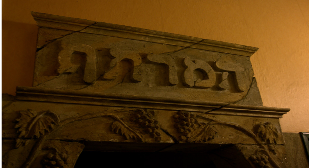
Fot. 1. Napis hebrajski oraz motywy winne - portal w budynku byłej łaźni żydowskiej. Photo 1. Hebrew inscription and wine motives - portal in former Jewish bath.

zwierzęcych lub roślinnych w budynkach sakralnych powinno jednoznacznie kojarzyć się bowiem z właściwym sposobem myślenia o wymienionych przedstawieniach, stosownym do miejsca. Z powodu potrzeby zachowania poprawności odczytu symboli o charakterze sakralnym, powszechnie w judaizmie odczytywanie ich znaczenia nie uległo na przestrzeni wieków dużym zmianom. Symble, powszechnie stosowane od XVI wieku, chociażby przy wejściach na teren kirkutów 3 , a najczęściej w górnych częściach macew 4 , podzielić można na określone grupy. Są to symbole przedstawiające cnoty imienne, narodowe, symbole płci i wieku, pochodzenie zmarłego, śmierć i wieczność oraz symbole zawodowe. [8]