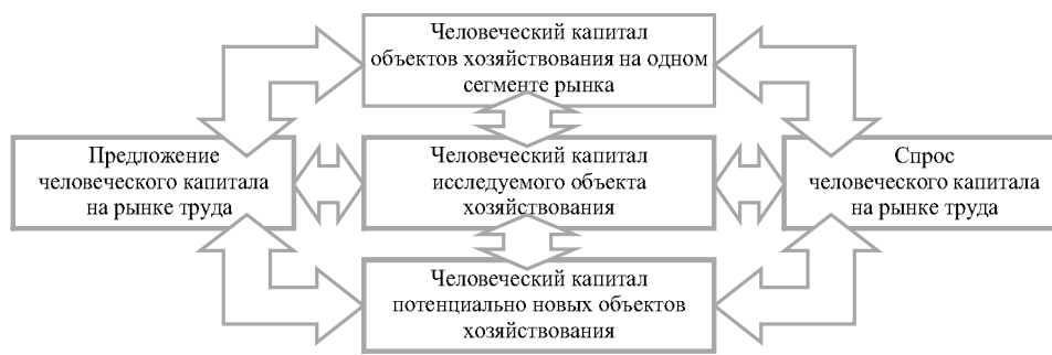
Рис. 1. Схема модели пяти сил конкуренции на примере функционирования человеческого капитала (авторская версия модели на основе развития идей М. Портера [20]).

На основе анализа публикаций ученых различных отраслей экономической науки в вопросах оценки конкурентоспособности, руководствуясь идеями М. Портера о конкуренции, положениями теории человеческого капитала [20], разработанными Г. Беккером, Т. Шульцем, их последователями, нами разработана схема-аналог модели пяти сил конкуренции на примере функционирования человеческого капитала (рис.1):