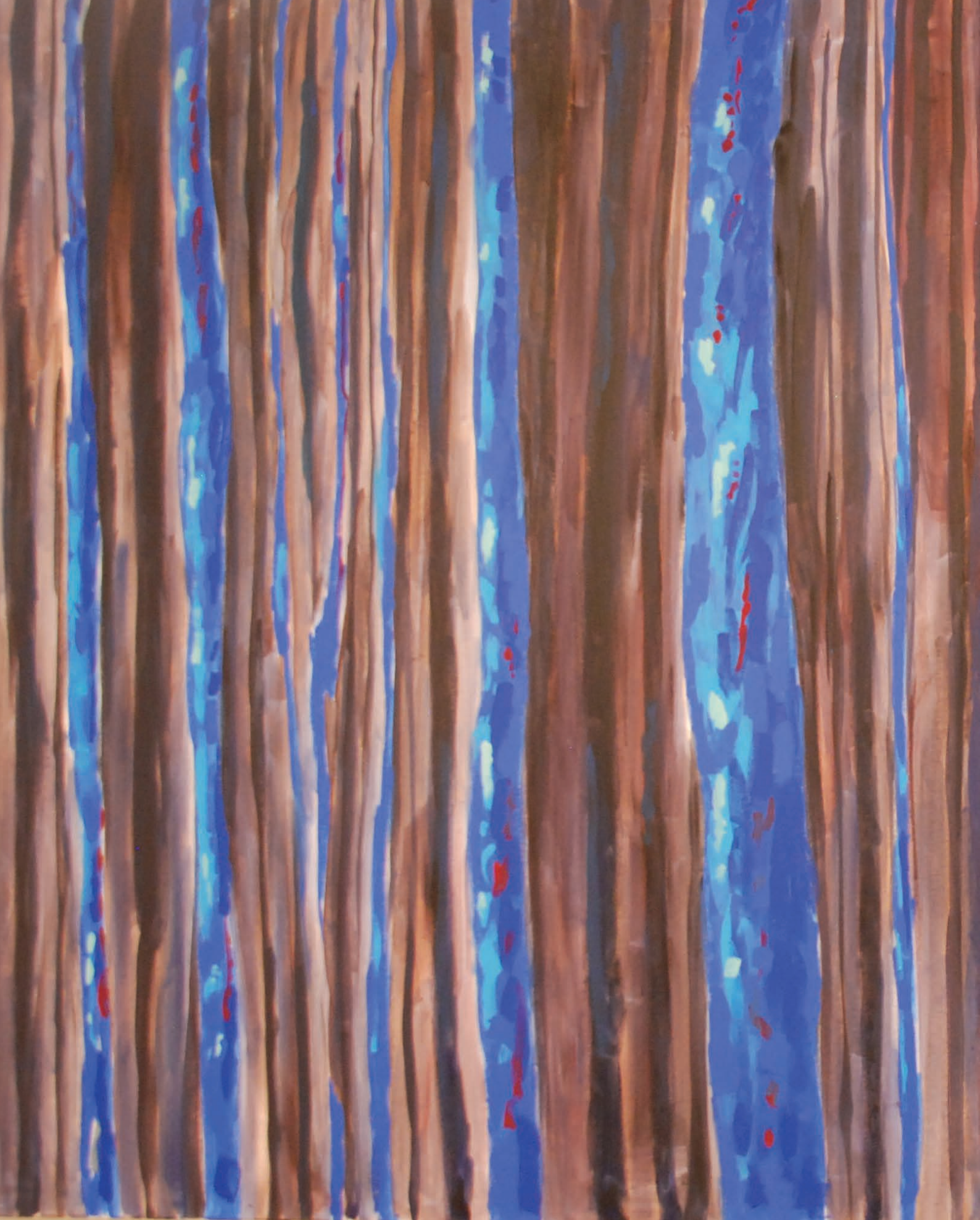
Inspire, 2023 120 x 150, 120 x 150 (dyptyk), akryl na płótnie