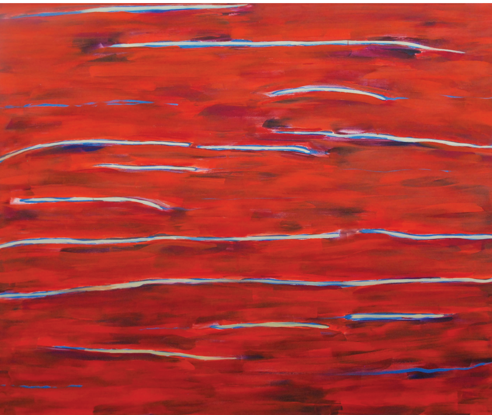
Medytacje no 3, 2023 120 x 150, akryl na płótnie