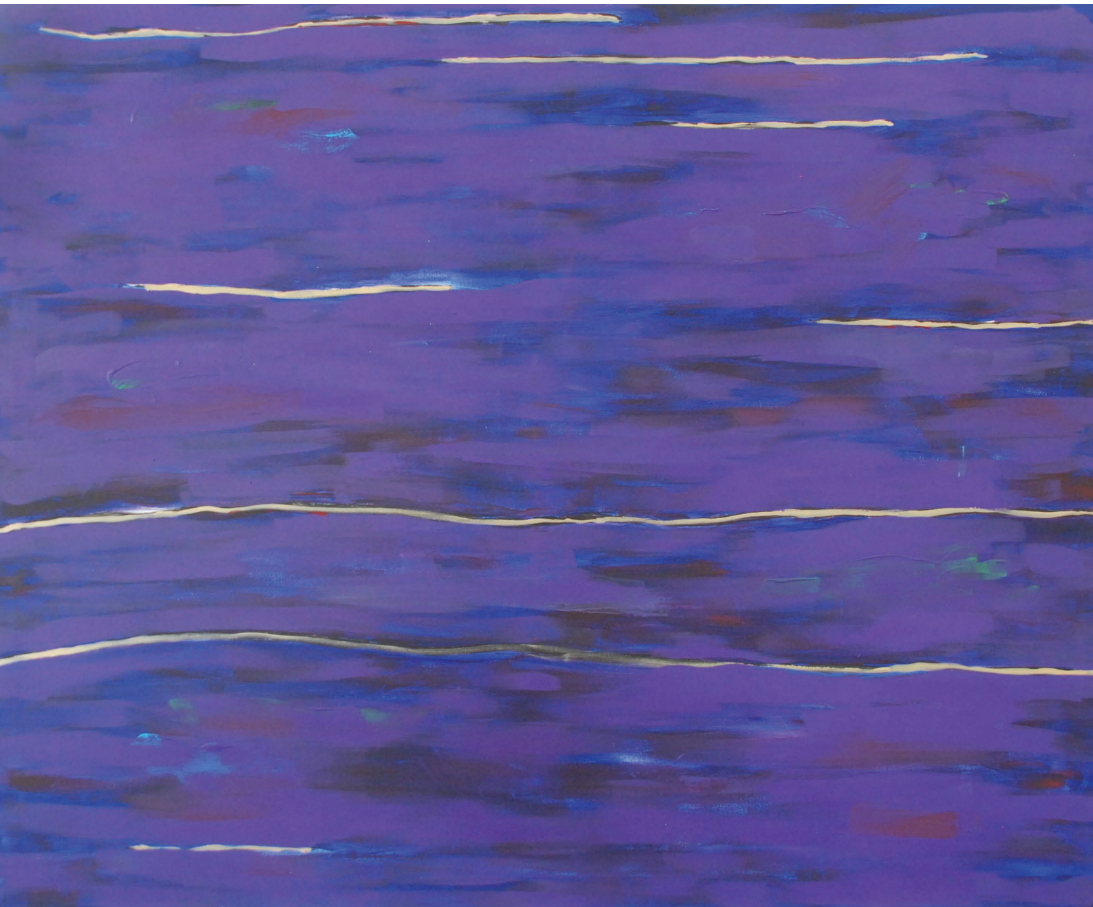
Medytacje no 1, 2020 120 x 150, akryl na płótnie