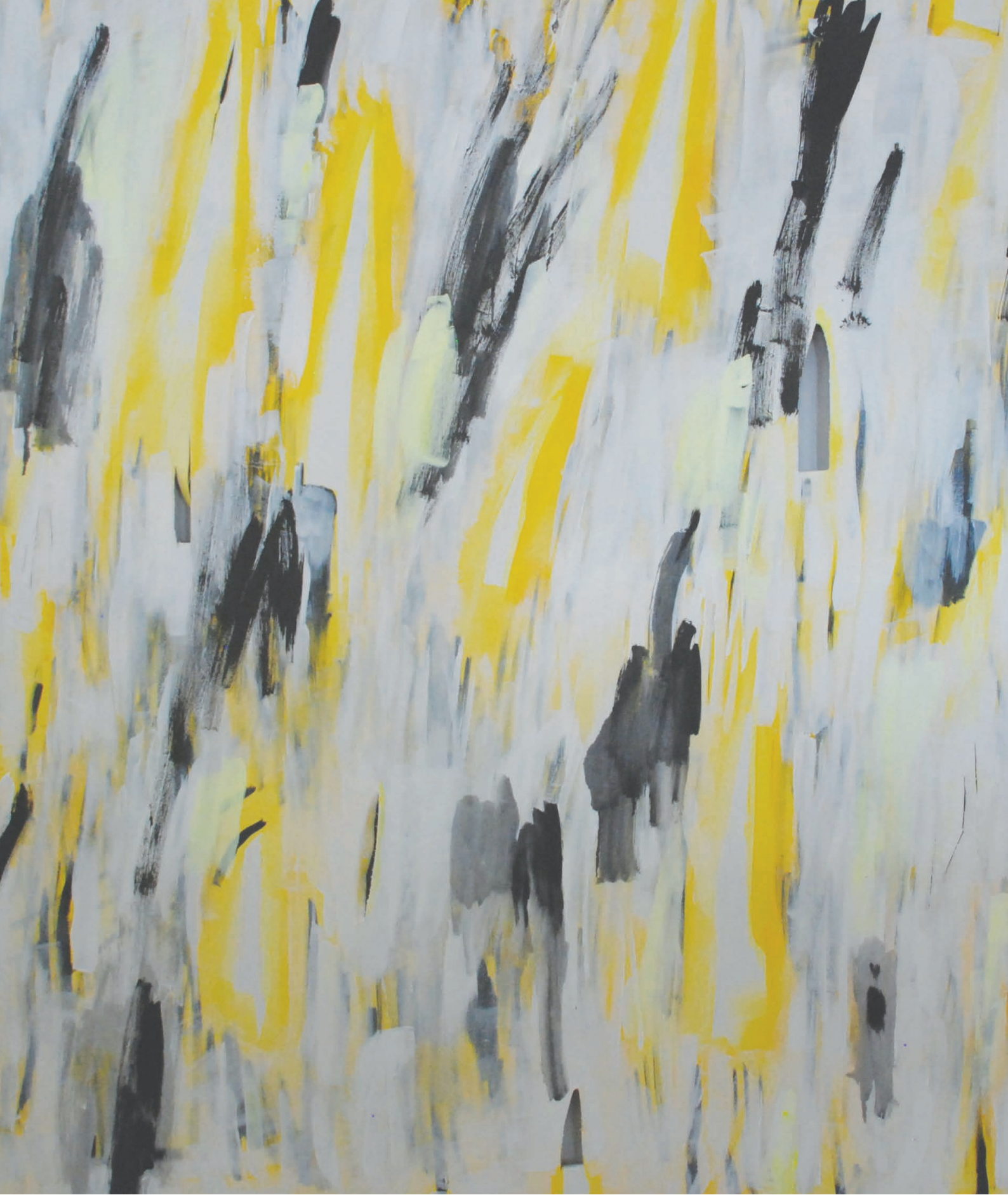
Przebudzenie no 1, 2022 120 x 140, technika mieszana