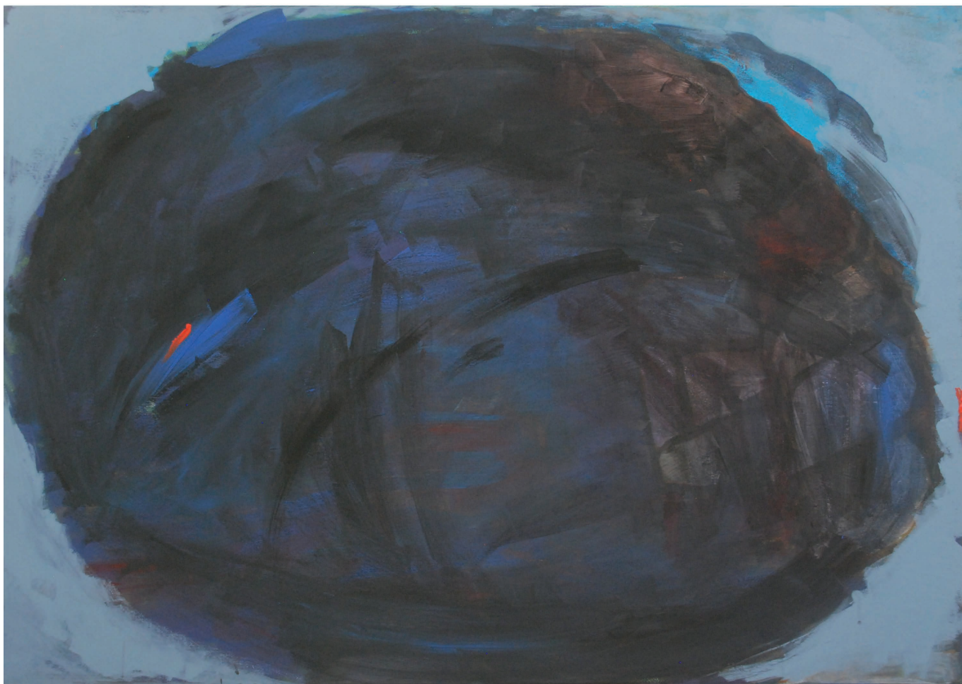
Poczek – Koniec , 2020 100 x 70, akryl na płótnie