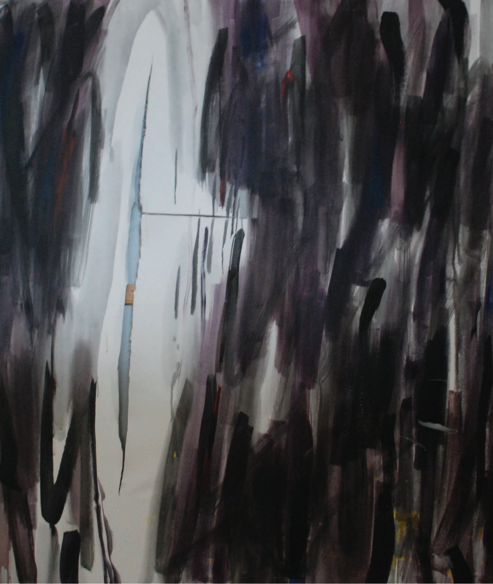
Przebudzenie no 2, 2022 120 x 140, technika mieszana