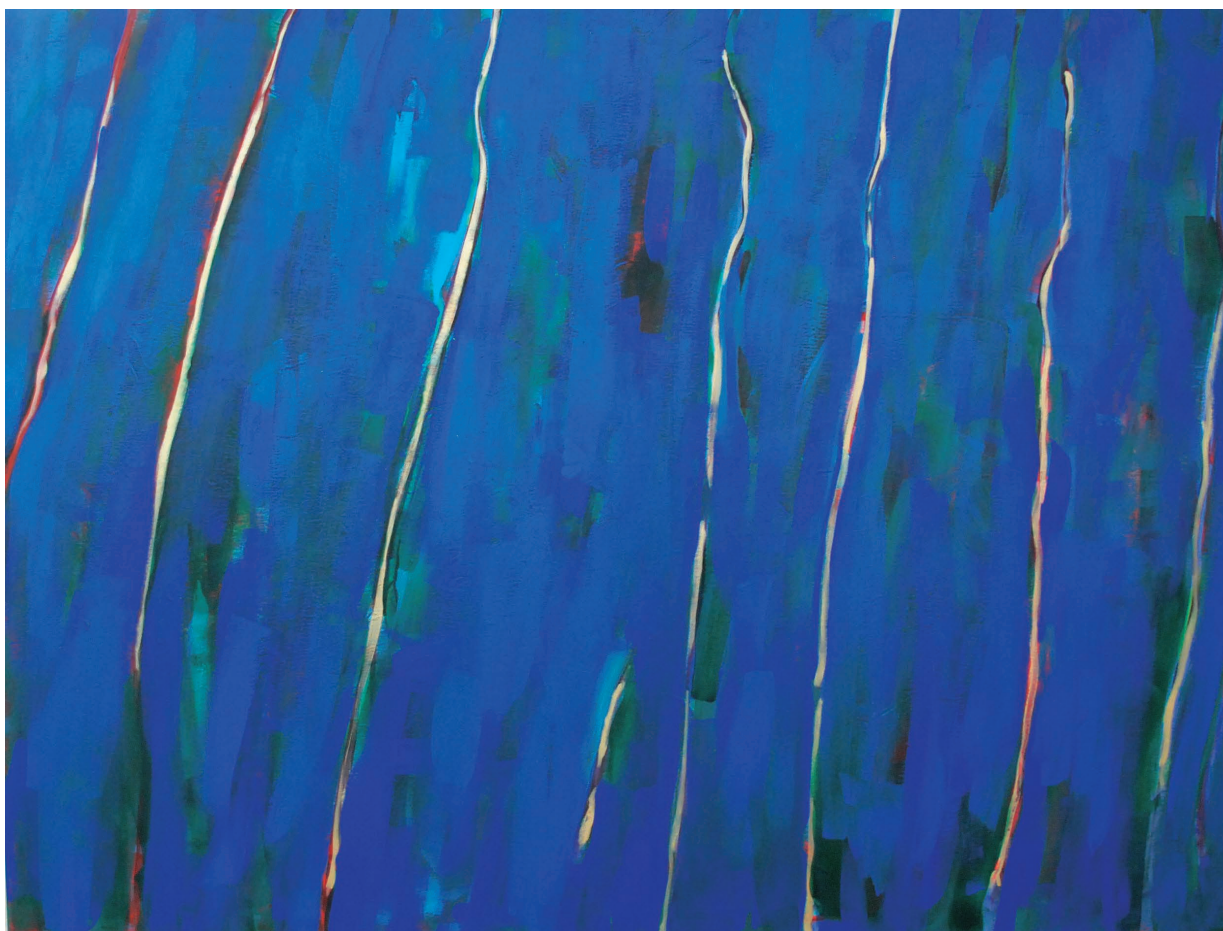
Medytacje no 2, 2020 100 x 130, akryl na płótnie