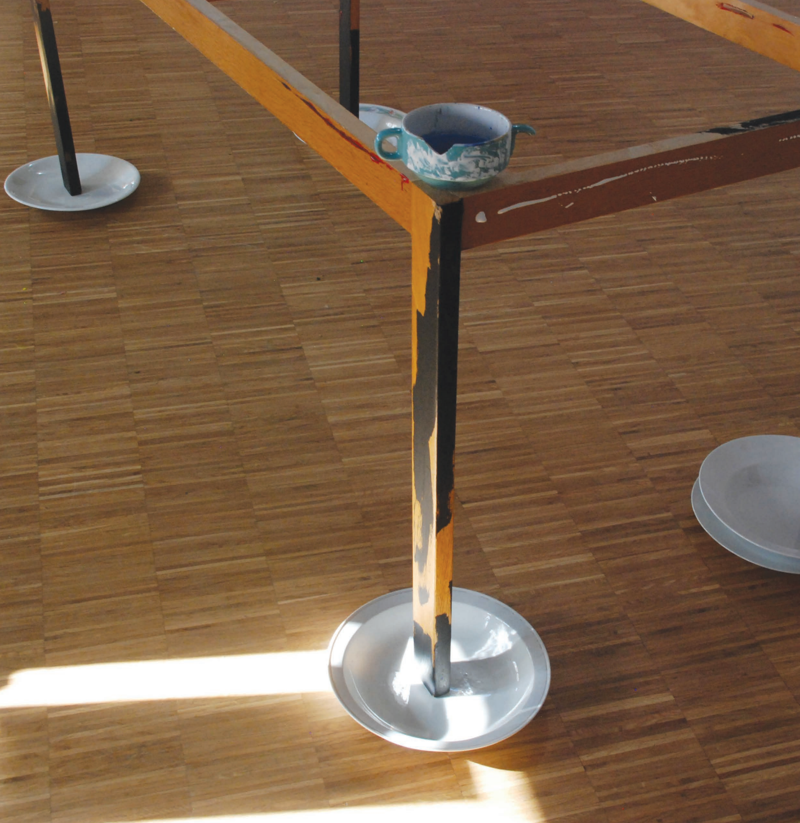
Home, 2023 instalacja przestrzenna