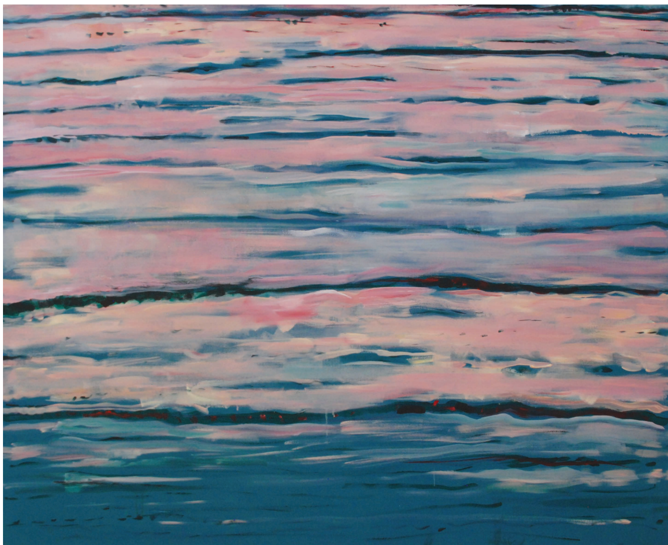
Modlitwa no 2, 2020 120 x 150, akryl na płótnie